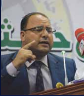
الشاعر فؤاد مطلب