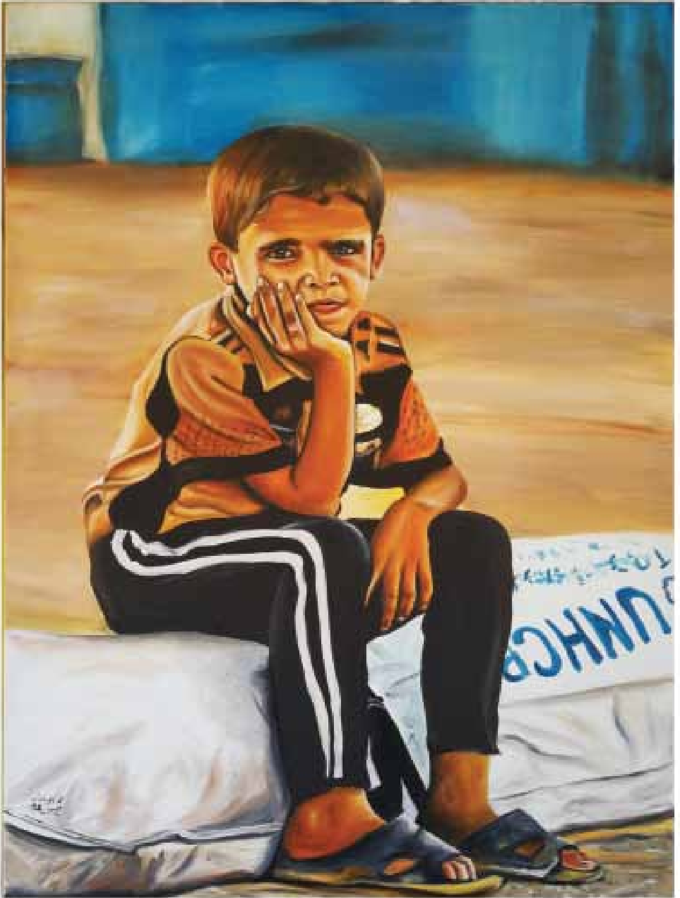
لوحة للتشكيلي محمد خير الجوفدار